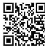
Zum kompletten Interview

Das vollständige Interview gibt es unter: https://nea-wis.de/ratgeber/vdk-bayern/ oder durch Scannen des QR-Codes