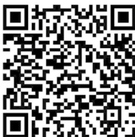
QR Code zum YouTube Video